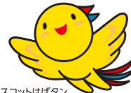
兵庫県マスコットはぼたん