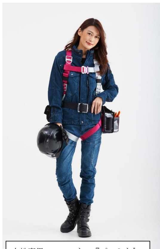
女性専用フルハーネス『プロミネ』