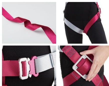
女性専用フルハーネス 『プロミネ』 金属パーツを減らし、 光沢感のあるベルトを 採用